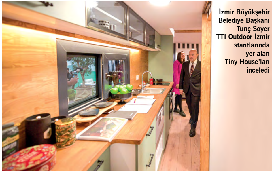
İzmir Büyükşehir Belediye Başkanı Tunç Soyer TTI Outdoor İzmir standlarında yer alan Tiny House'ları inceledi